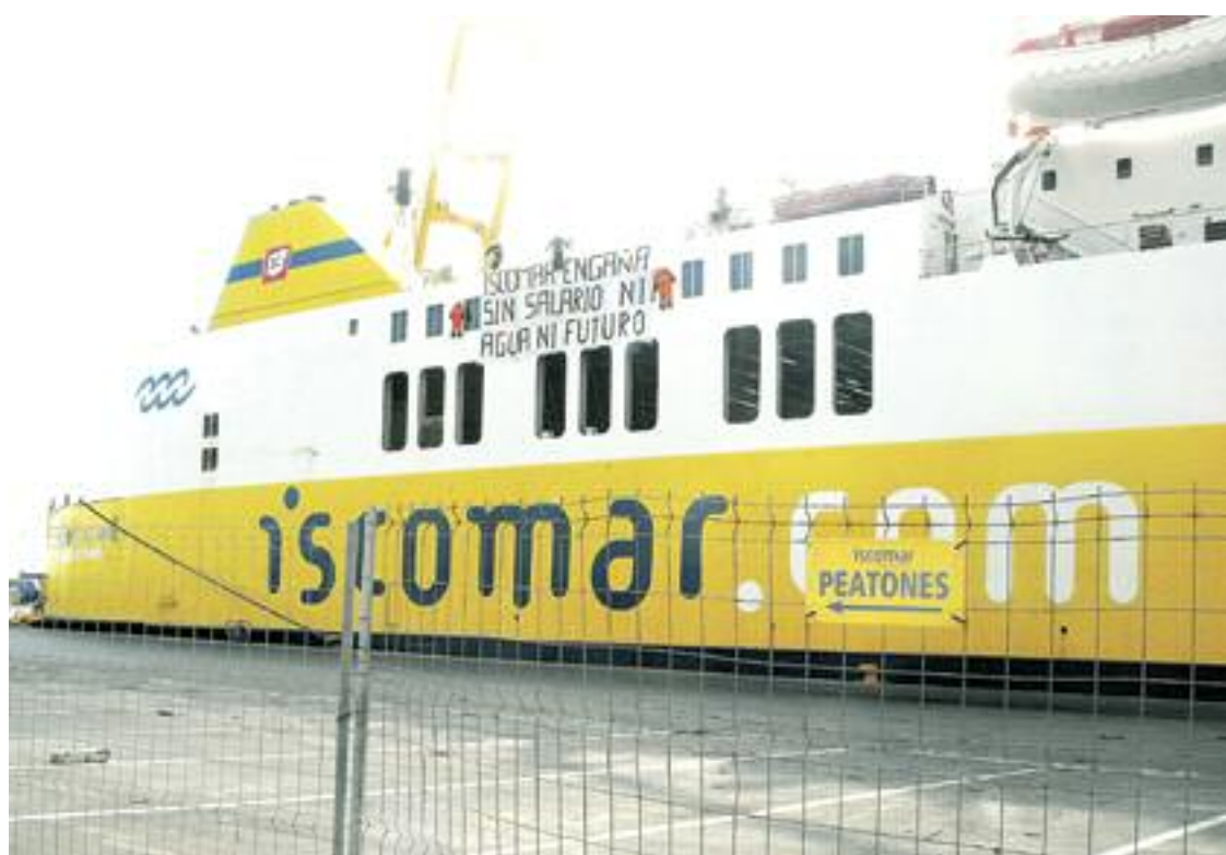
El Mercedes del Mar en el muelle del puerto de Valencia.

Desde el Sindicato de Trabajadores de la Marina Mercante de la Confederación General del Trabajo (CGT) exigimos el pago de los salarios de los trabajadores y una salida digna y justa a su situación, así como pedimos la solidaridad de todos los ciudadanos y ciudadanas.